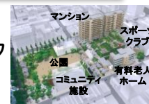
大阪府:大阪府宮城方田ノ口住宅建替事業

○廃校跡地等、低未利用の公的不動産の有効活用等について、民間の資金・ノウハウを活用するPPP/PFIの導入を促進