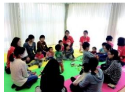
若者世代の入居と多世代交流の促進