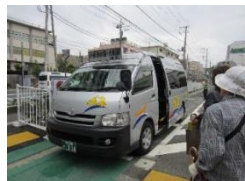
コミュニティバスの導入等