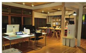
住宅をシェアオフィス等として活用