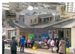
高齢者施設や店舗の誘致

○居住者の高齢化等により多様な世代の暮らしの場として課題が生じている住宅団地について、生活利便施設や就業の場等の多様な機能を導入することで、老若男女が安心して住み、働き、交流できる場として再生