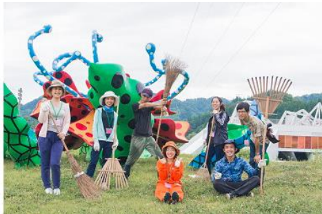
(地域イベント「大地の芸術祭」に関わる主に首都圏を中心とするサポーター) ＜新潟県十日町市・津南町＞