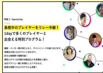
地域のプレイヤーをオンラインでリレー中継し、地域との多様な繋がり方を学ぶ (島根県、(株)シーズ総合政策研究所)