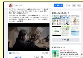
会員同士が取組のマッチング、ブラッシュアップなどを図るためオンラインで交流