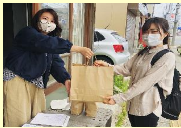
地域の便りとお米のお裾分けで心のつながりを強くする取組み (長岡市 (公社)中越防災安全推進機構)