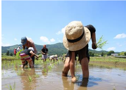
(酒米田んぼのオーナーとなり、生産者や地域を応援する取組) ＜茨城県笠間市＞