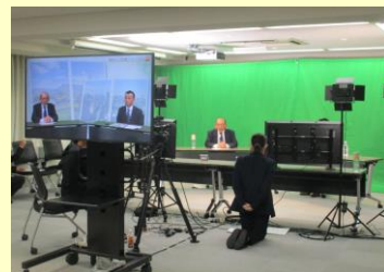
関係人口全国フォーラム (令和2年10月16日 オンラインにて開催)