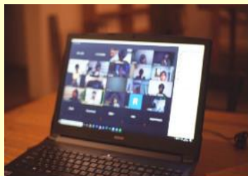
直接の移動・面会ができない間は、オンラインで関係を構築・維持 (遠野市 (株)Next Commons)