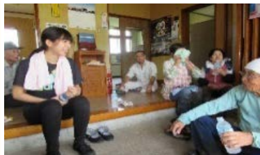
県内都市部の大学生が農家のお手伝いを通じ関係づくり（長岡市（公社）中越防災安全推進機構）