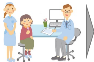
受診に合わせて自動でボランティアタクシー等を配車