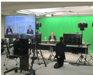
関係人口全国フォーラム（R2.10.16 オンラインにて開催）