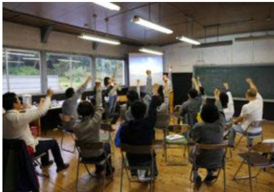
ローカルベンチャースクール