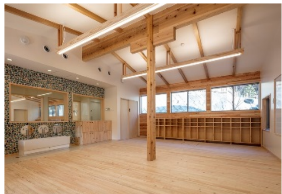
KIDS GARDEN LABO