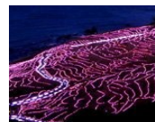
白米千枚田 (石川県輪島市)