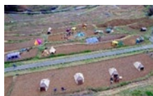
稲倉の棚田 (長野県上田市)