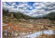
井仁の棚田 (広島県安芸太田町)