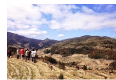
高知県本山町「本山丸ごと産地付加価値推進事業」