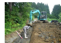
地すべり防止事業 (頸城地区)