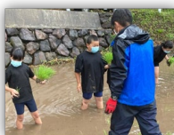
幸田頭の棚田における再生・保全活動 (鹿児島県湧水町)