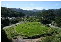
蘭島の棚田 (和歌山県有田川町)