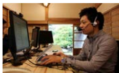
Sansan株式会社 神山ラボ(徳島)