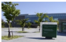
慶應義塾大学鶴岡タウンキャンパス