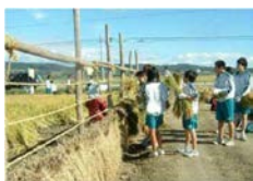
2024年度に小学生、中学生、高校生について現在の取組を倍増