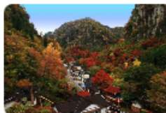
クリックで写真を拡大