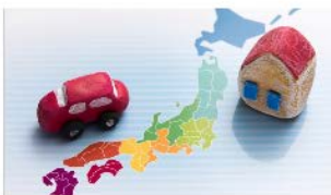
マッチングサイトを開設して 求人情報等を提供している都道府県一覧