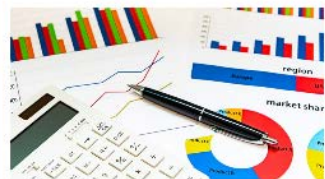
起業支援金・移住支援金 (地方創生起業支援事業・地方創生移住支援事業)