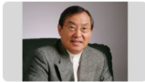
大前 研一氏 (2/2) ビジネス・ブレークスルー大学 学長