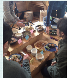
田舎暮らし体験ツアーの様子 (福島県奥会津)

移住希望先の様子を知りたいときや、移住候補地を絞り込みたいときに利用したいのが、「田舎暮らし体験ツアー」です。最近では、全国各地の自治体などが企画した1泊2日～2泊3日程度の短期間で地方暮らしを体験できるツアーも数多くあり、手軽に地域を知ることができる方法として知られるようになってきました。民間の旅行会社が主催する通常のツアーよりも、農作業体験や伝統食体験といった、その土地ならではの体験企画が多く含まれている点が特長です。また、地域住民や先輩移住者と交流できる機会が組み込まれていることも、移住希望者には嬉しいところ。比較的リーズナブルな料金で参加でき、しかも「暮らす」という観点で効率よく地域を巡ることができる「田舎暮らし体験ツアー」を、ぜひ利用してみましょう。