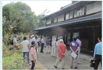
空き家ツアー(山梨県身延町)

近年、増加傾向で全国的な社会問題となっているのが空き家です。空き家といっても、「完全に人が住んでおらず管理もされていない状態のもの」「普段は人がいないが仏壇があるため、お盆や正月など決まった時期のみ人が集まる(住む)もの」など、形態はさまざま。定期的に入りの手が入る空き家であれば家屋も良好な状態で維持されますが、放置されたままの空き家の場合は、外壁が傷んで美観を損ねる、雑草が生い茂り衛生状態が悪化する、不審者侵入