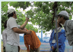
新規就農実務研修(岡山県吉備中央町)

農業の経験がない人が就農を希望する場合には、国や自治体などが開催している短期間の農業体験に参加してみましょう。また、農業大学校や農家・農業法人で研修を受けることもできます。国や自治体では就農支援を行っていますので、自分の目指す農業のイメージができてきたら、自治体や各都道府県に設置している新規就農相談センターに積極的に問い合わせしてみましょう。また、「 新・農業人フェア 」などの就農フェアには、新規就農者を積極的に受け入れている全国の自治体・農業法人が集まりますので、是非参加してみましょう。