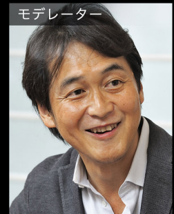
夏野 剛 慶應義塾大学大学院 政策・メディア研究科 特別招聘教授