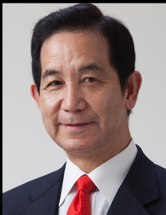
山本 幸三 地方創生担当大臣