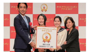
▲ フード・アクション・ニッポンアワード2017