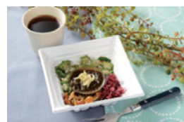
▲ 糸島産ふともずくを味わうネバネバサラダ