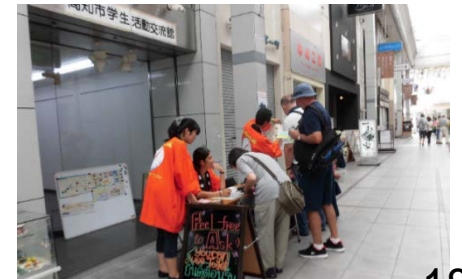
〈学生グループ「コンパス」による観光案内〉