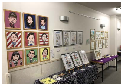
〈芸術グループによる絵画展〉