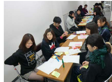
〈学生によるまちづくりワークショップ〉