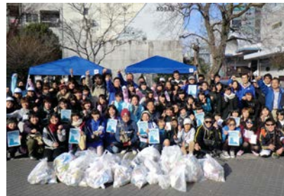
〈スポーツGOMI拾いin城下町〉