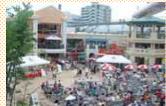
優良な民間都市開発事業の支援