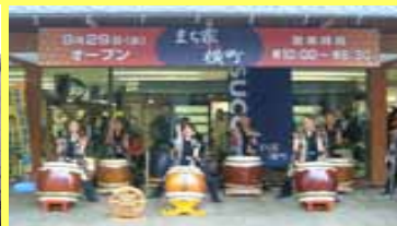
空店舗の活用 イベントの実施