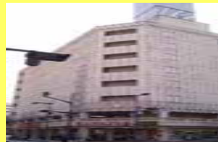
空きビルの改修 コンバージョンの支援