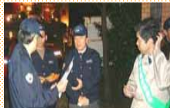
地域ぐるみの安全対策