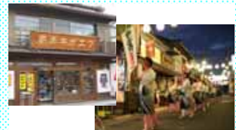
ひとづくりによる 地域の再生