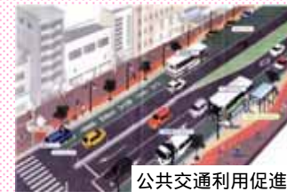
公共交通利用促進