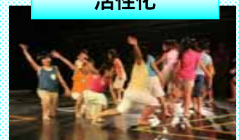
文化芸術による コミュニティの再生