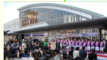
駅前におけるスポーツイベント (高校サッカー・藤枝東の準優勝記念イベント)

○駅北口における公共用地を活用した市街地再開発事業、暮らしにぎわい再生事業の実施