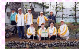
「この草花・緑化木は私たちがまちづくり委員会が大切に育てています。」

○地域の景観、環境美化を促進する取組 ・まち美化里親制度(アダプトサイン設置) ・「 まちをきれいに する条例」による 市民団体等の美化活動の支援