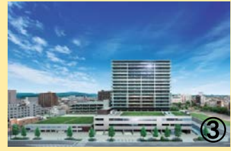
③ 大垣駅南街区第一種市街地再開発事業イメージ

大垣駅南口の正面に位置する区域に再開発ビルを建設し、住宅、商業施設などの複合施設を整備する。