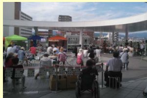
JR茨木駅東口の社会実験

・道路法の特例を活用し、まちづくり会社が駅前広場(市道区域)の占用許可を得て、市民の利便増進施設(オープンカフェ等)を整備し、駅前に居心地の良い上質な空間を作る。