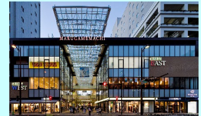
＜高松市丸亀町グリーン＞ 大店立地法の手続きを実質的に適用除外