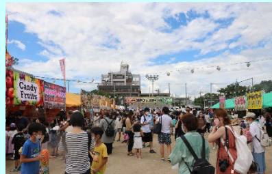
＜茨木フェスティバル＞ イベント等の開催