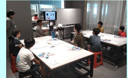
＜長岡市ものづくりラボ＞ ワークショップ等の実施