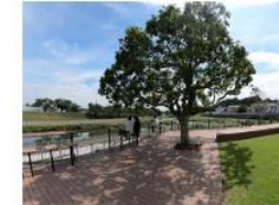
カウンターデッキ