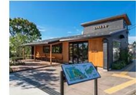
ベーカリーカフェ デিজィ