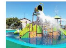
ウォーターパーク