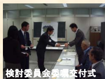
検討委員会委嘱交付式