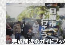
完成間近のガイドブック