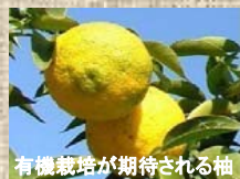
有機栽培が期待される柚