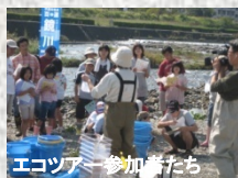
エコツアー参加者たち