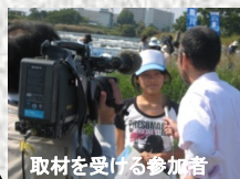
取材を受ける参加者