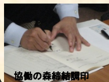
協働の森締結調印