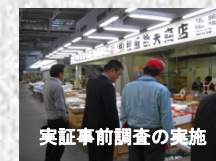
実証事前調査の実施

「エコ商店街の実証実験と食等の新た な売り込み方法の実証実験」旅100のオプ ショナル実証 ・日曜市集客交流PR事業 ・ECO 商店街実証事業