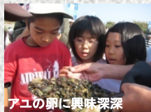
アユの卵に興味深甚