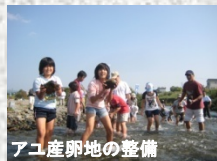
アユ産卵地の整備

「天然資源を再調査、再発見し、生か していく実証事業の実施」・100万尾天 然アユ復活事業 ・眠れる資源再発見事業