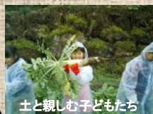
土と親しむ子どもたち