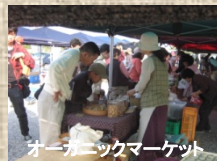
オーガニックマーケット