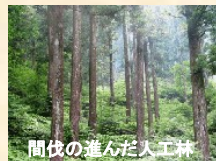
間伐の進んだ人工林

「企業等の寄附による、民有林整備 手法の構築」・民有林版「高知市・協働の 森事業」の構築