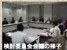
検討委員会会議の様子

「有機無農薬等ECO農業の普及とブラ ンド化の実証実験」・有機無農薬等ECO農業 推進・ブランド化事業 ・有機市民農園開設