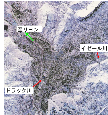
Grenoble PDU 2000年版より