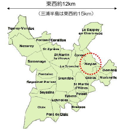
Agence d'Urbanisme HPより