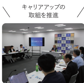
キャリアアップの取組を推進

3UP循環の成功モデル創出に向け、CUUの運営方針決定や、SDGsに関する施策の普及啓発、構成メンバーによるシナジー創発、取組の検証・評価を行う。県内就業者の能力開発の方向性、環境づくりを総合的にデザインする。