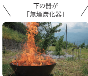
下の器が「無煙炭化器」

土壌中の炭素量を年間4パーミル(0.4%)増加させる取組。無煙炭化器でモモ・ブドウの剪定枝を炭化し、土壌に投入する。認証制度によるブランド価値創出が期待される。