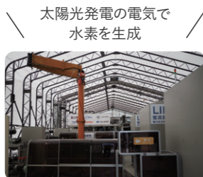
太陽光発電の電気と水素を生成

再生可能エネルギー電力と水を使いグリーン水素を製造し、工場等へ供給。県内機械電子産業の水素・燃料電池分野への参入や関連研究機関・企業の集積による産業振興も推進。