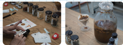
食材を混ぜて自分だけの醤油作り

うすくち醤油発祥の地、兵庫県たつの市。発酵LabCooは、そこで「地産地酵」の取組をしている。「地産地酵」とは、地域の人々が地域の食材を使って地域の味を醸す活動である。