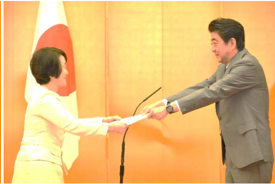
安倍総理大臣から選定証を授与 (代表:横浜市)