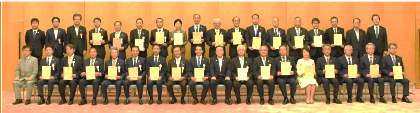
SDGs未来都市(29自治体)と梶山大臣他との集合写真