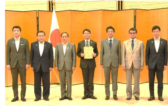
SDGs未来都市との写真撮影 (例:小国町)