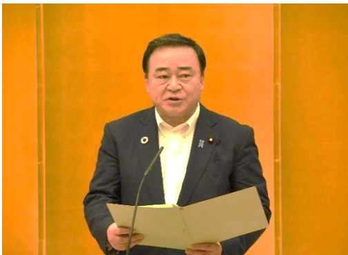
梶山地方創生担当大臣御挨拶