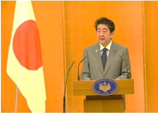
安倍総理大臣御挨拶