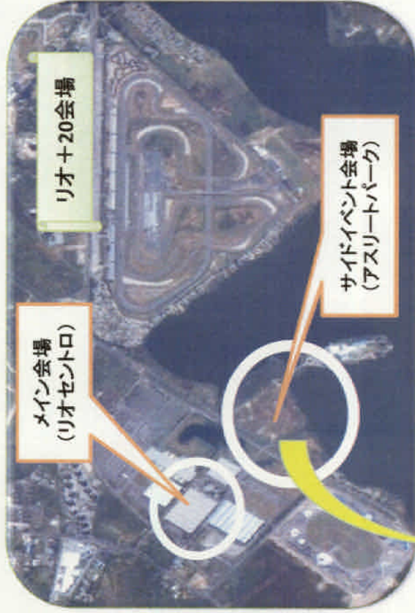
メイン会場 （リオセントロ）