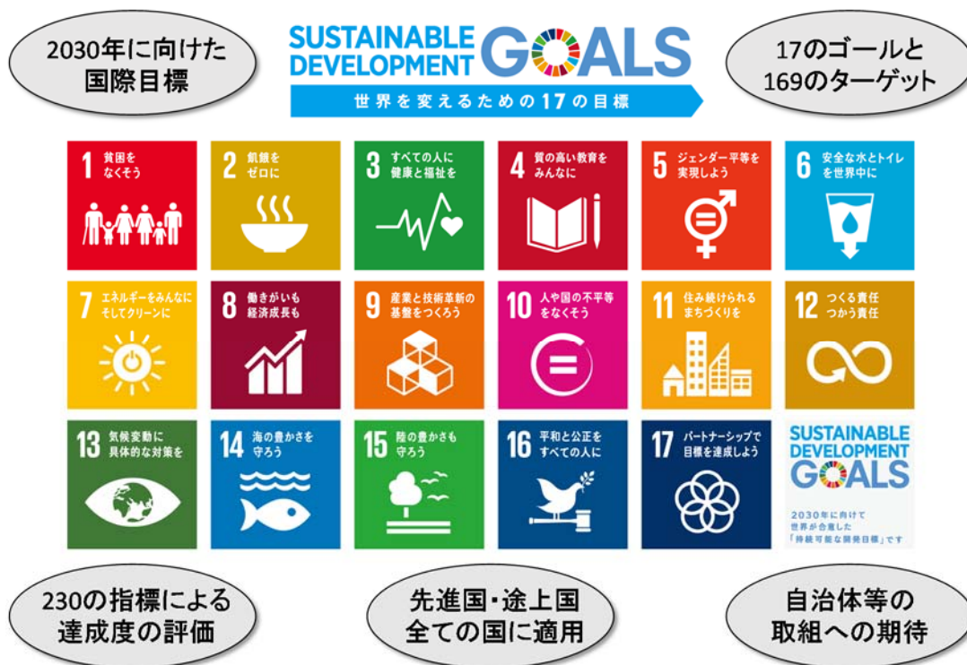
図1. 持続可能な開発目標（SDGs）の概要

SDGsとは、人類及び地球の持続可能な開発のために達成すべき課題とその具体的な目標です。向こう15年間、すなわち2030年までに実行、達成すべき事項を整理しています。