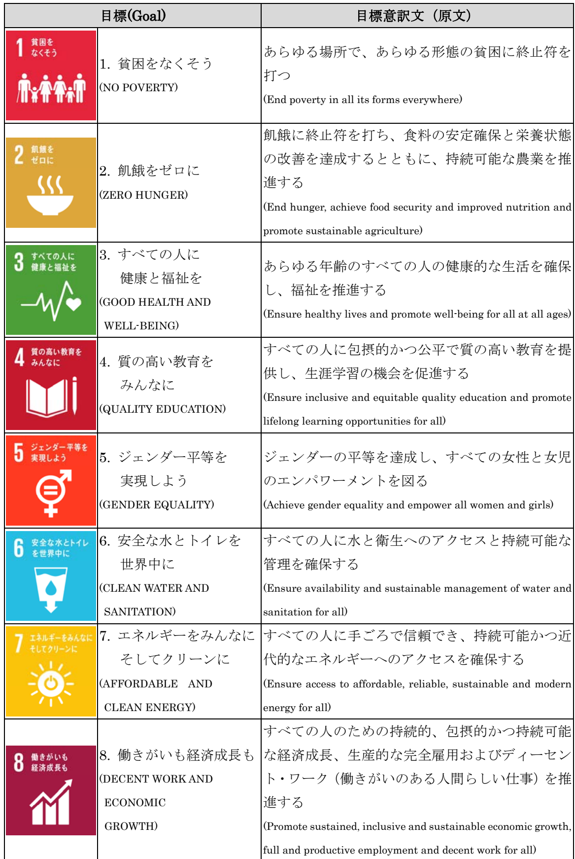
表 SDGs の 17 のゴール 1