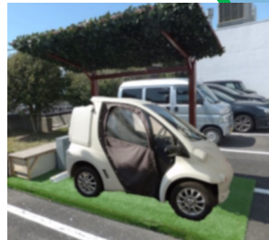
太陽光電池搭載の非接触給電ステーション及びグリーンスローモビリティのイメージ