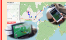
地域交通情報アプリケーションのイメージ