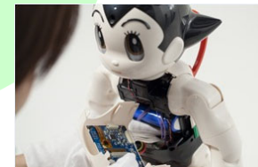
学生によるロボット製作のイメージ