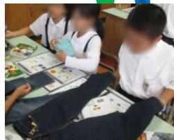
ジュニアジーンズソムリエ (小学生向け出前講座)

((( Wi-Fiが無料で使えます! ))) 高梁川流域フリーWi-Fi 7市町が整備・運用