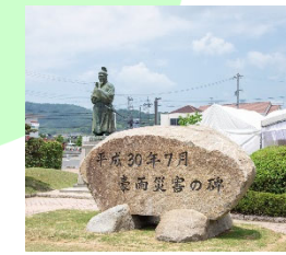
平成30年7月豪雨の碑