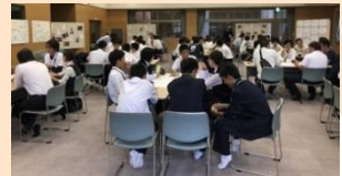
壱岐なみらい創りプロジェクト

三側面をつなぐ統合的取組 Industry4.0を駆使した スマート6次産業化モデル構築