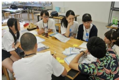
イノベーションプログラム