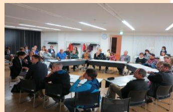
まちづくり町民講座