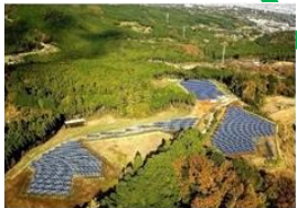
再生可能エネルギーの取組