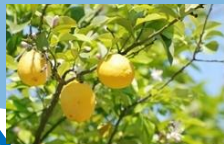
農産物のブランド化