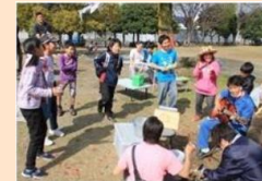
子どもの居場所 (プレイパーク)