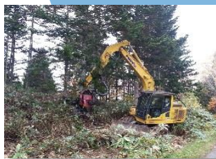
林業のシームレス産業化