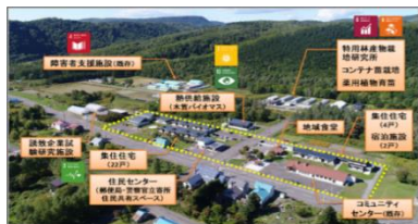
一の橋バイオビレッジ