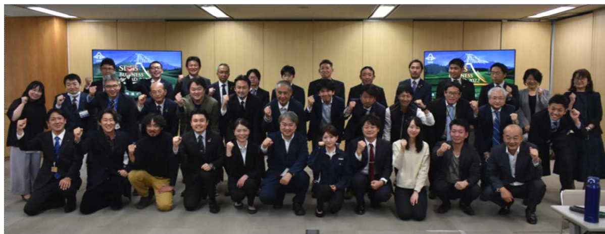
キックオフミーティング（R4.11） （採択団体、メンター、協力パートナーの皆さん）