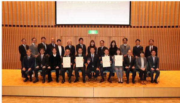
成果発表 & 表彰式（R4.3）