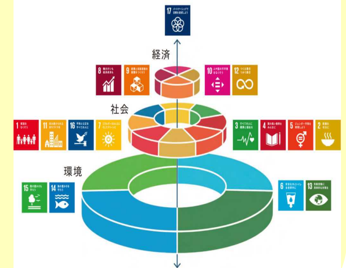
出典 スtockホルム・レジリエンスセンター "The SDGs wedding cake"

自律的好循環・環境と経済の両立の実現 「SDGsのモデル県」として持続可能な発展へ