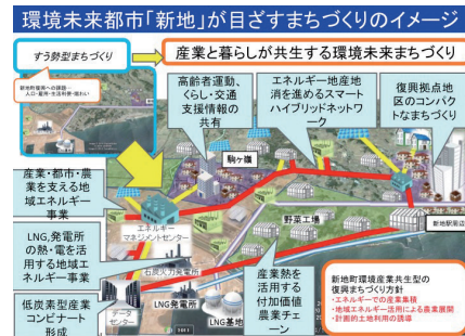
環境未来都市「新地」が目指すまちづくりのイメージ

環境都市の暮らしと産業の実現の観点から、産学官が連携したネットワークを形成し、環境関連産業に係る情報交換などの場を創出。地域エネルギーの利活用調査や事業化検討、持続可能な環境都市の暮らしの実現に向けた調査研究を行っていく。