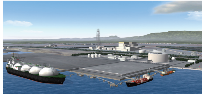
相馬 LNG 基地イメージ。20ヘクタールの敷地に地上式 23 万キロリットルの貯槽 1 基

平成 25 年 11 月、石油資源開発株式会社と県と町との間で、相馬港における LNG 基地立地計画を円滑に促進することを目的とした基本協定が締結された。相馬港で LNG 基地建設計画が進んでおり、地域エネルギーの利活用検討やエネルギー関連産業の集積促進など、エネルギー地産地消のまちづくりを計画。天然ガスの新規大量供給に伴う地域産業誘致・雇用創出など関連産業創出の可能性に期待が高まっている。