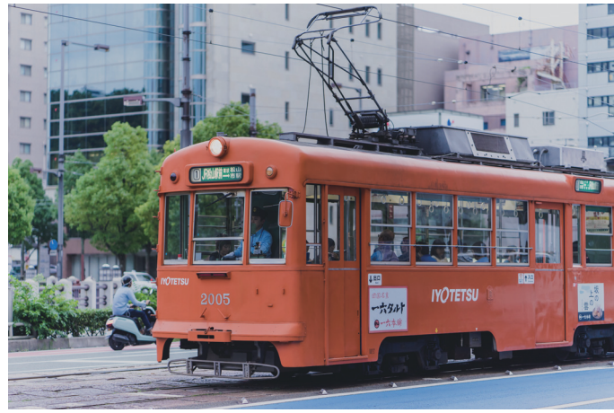
まちなみに溶け込む路面電車 松山の緑多い風景にオレンジ色の路面電車がよく似合う。古い車両も現役で活躍。