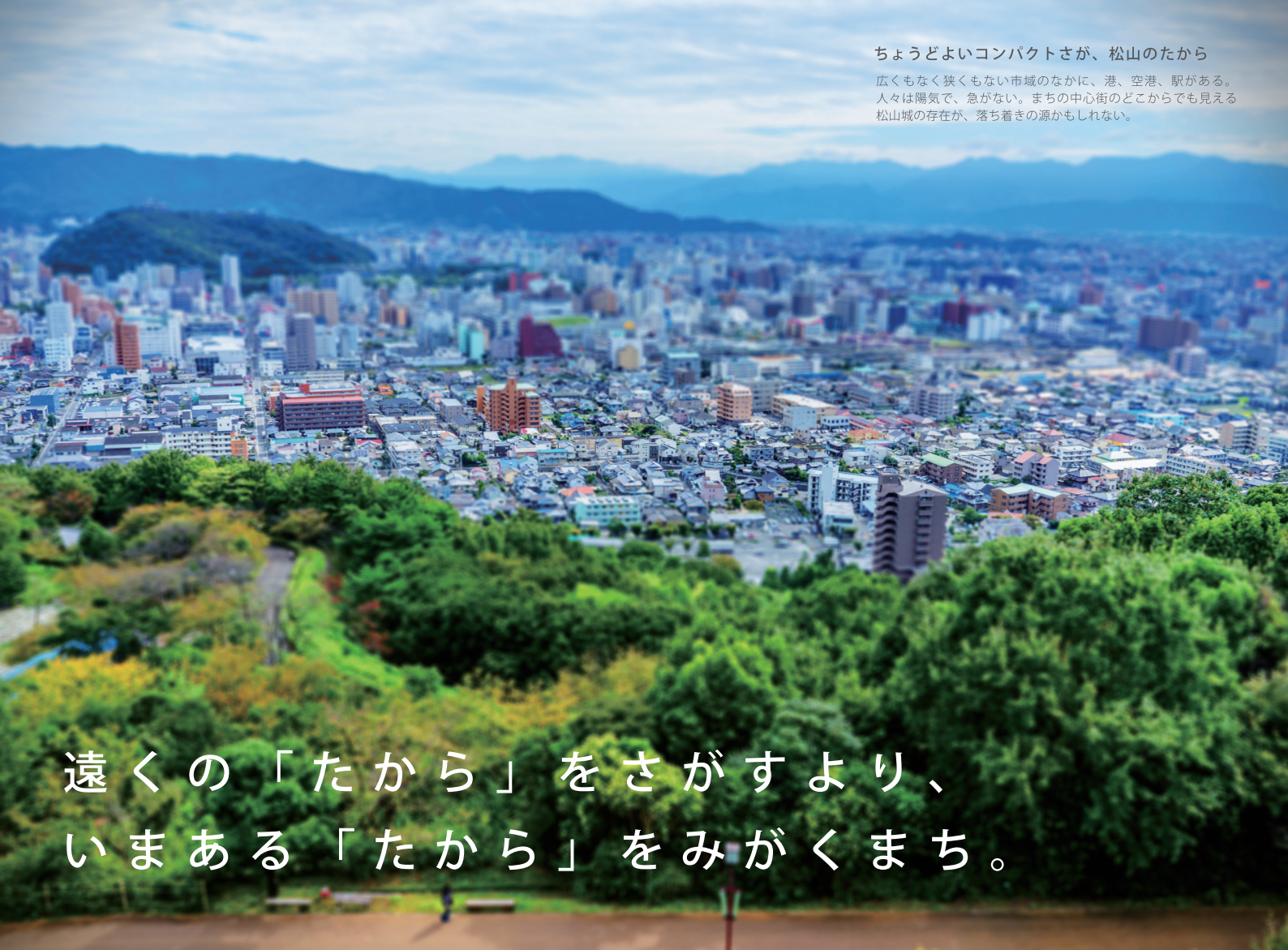
ちょうどよいコンパクトさが、松山のたから 広くもなく狭くもない市域のなかに、港、空港、駅がある。人々は陽気で、急がない。まちの中心街のどこからでも見える松山城の存在が、落ち着きの源かもしれない。