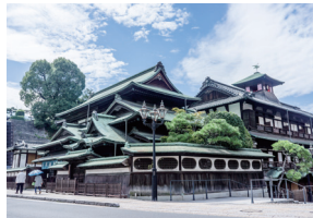
歩行空間を整備しにぎわいが復活した道後温泉 「歩いて楽しい健康増進のまちづくり」の一環で、2008年に歩行空間を整備。夏目漱石、正岡子規をはじめ明治文学との関わりも深い国の重要文化財であり、近い将来、保存修復工事を控える「たからみがき」の代表的存在だ。