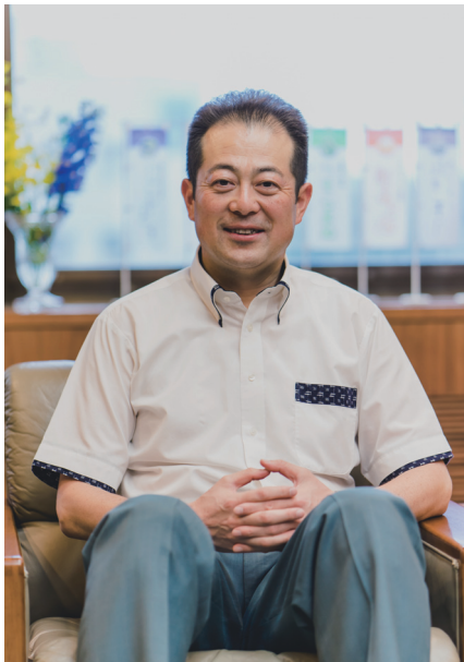
松山市長 野志克仁 南海放送アナウンサーを経て、2010年松山市長就任。現在2期目。市民参加による「幸せ実感都市」を目指す。