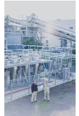
消化ガス発電システムの 一部を背景に

消化ガス発電の設置を率先して推進してきたお二人。市内の他の下水処理施設にも展開できればと語る。