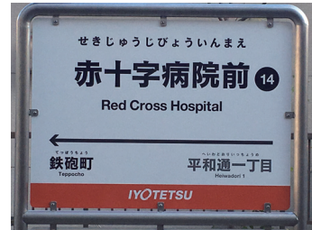
松山市文教地区のシンボルとして

すぐ近くの市電の電停も「赤十字病院前」。市民になじみの深い文教地区の中心で、新築後も運営される意味は大きい。