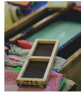
道具ひとつとっても、 ていねいに手入れされている。 『手漉き和紙工房』