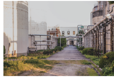
四国で初めて建設された 下水処理場が中央浄化センター

自然の恵みも生かした省エネ・創エネで環境配慮に取り組み、建築物の環境性能評価CASBEEでSランクを達成。基準モデルよりライフサイクルCO 2 排出量を31%削減する。