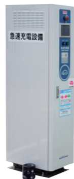
市内5ヶ所の公共施設駐車場にEV用急速充電器を設置。