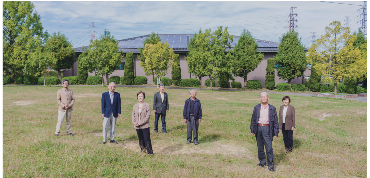
『生駒市民共同発電所』1号機の前で『市民エネルギー生駒』のみなさん

小瀬保健福祉ゾーンの介護老人保健施設南向き方面の空き地を利用し、56.0kWを発電。売電収入で、施設にパワーコンディショナー1基を寄贈した。2016年3月に完成。