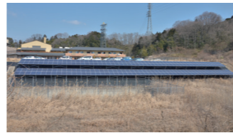
『生駒市民共同発電所』3号機

2016年2月に完成。「生駒市南こども園」の園舎屋上に設置。57.9kWを発電する。「南こども園」は、LEDによる全館照明、ペアガラスなど、省エネ設備が充実。0歳児から5歳児まで一貫した幼児教育・保育を行う。「市民エネルギー生駒」は売電収入で園舎デコレーションパネルを寄贈した。