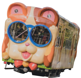
市民にも人気！生駒ケーブルカー『ミケ』。

生駒市のキーワードは、みんなで創る日本一楽しく住みやすいまち「生駒」。“みんなで創る”という言葉に、小紫市長は市民と役所の垣根を越えた「協創」の思いを込め、「みんなで何かしたい、という気持ちを、どれだけ本気で醸成し、形にできるかが、地方創生時代の自治体の腕の見せ所」と語る。市の職員には、自分の周りの商店街や子育て・介護など市民サークルの人たちと積極的に信頼関係を築き、パフォーマンスをあげてほしい、と考えている。 「市役所というより、チーム生駒市」という感じ。いい意味でどの課が何をしているかわからないほど、職員には市民とどんどん一緒に動いてもらいたい。「生き残り」というよりも、人々に選んでもらえる「楽しく素敵なまち」を目指しているんです」と抱負を語った。 40代前半の若き市長の目は、まちの環境を守ることと市民みんなと創りあげていく、住みよい未来に向いている。