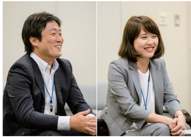
大阪ガス株式会社エネルギー事業部 地域新電力事業担当のお二人

住宅の見学と合わせて、公園や病院、保育園、小学校など、生活施設を見学。副市長が住宅施策を説明するなど、市の本気が伝わった。市街を一望できる自然菜食カフェで、先輩ママとランチ交流するなど、きめ細かいプログラムが成功を支えた。