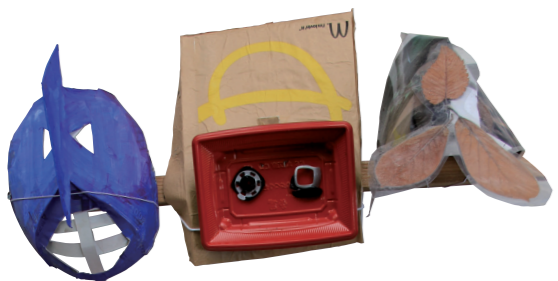
坂本善三美術館に展示されていた子どもたちの作品

町出身の偉人、北里柴三郎氏が提唱した「学習と交流」とは、知恵と工夫で自ら未来を開くこの地の人々の気質そのものかもしれない。