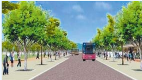
トランジットモールのイメージ

国道129号とトランジットセンターを結ぶツインシティのシンボルとなる通りで、人々が安心して歩け、地域の交流と賑わいの拠点となるよう、原則として、バス等の公共交通機関以外の車両は、通行できないよう工夫します。