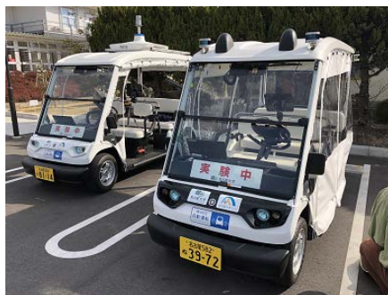
小型電動自動車 (ヤマハカート)