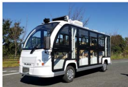
自動運転車両（8人乗りEV）