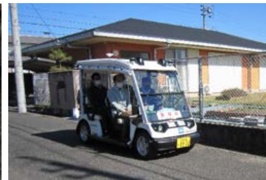
ゆっくり自動運転実証実験