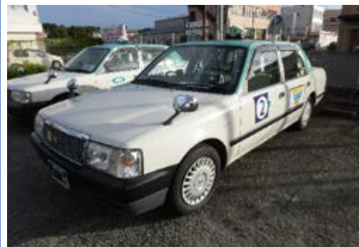
AIオンデマンド乗合サービス実証実験