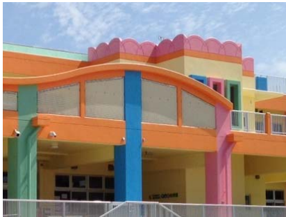
認可保育所等の増