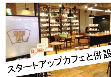
スタートアップカフェと併設