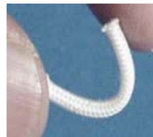
新素材人工 神経・血管