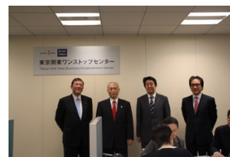
平成27年3月31日（火） 開所式