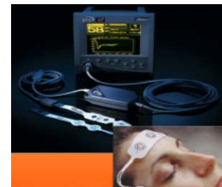
脳波等を利用した 診断機器