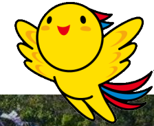
兵庫県マスコット はばたん