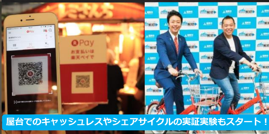
屋台でのキャッシュレスやシェアサイクルの実証実験もスタート！