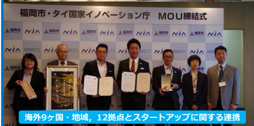
福岡市・タイ国家イノベーション庁 MOU締結式