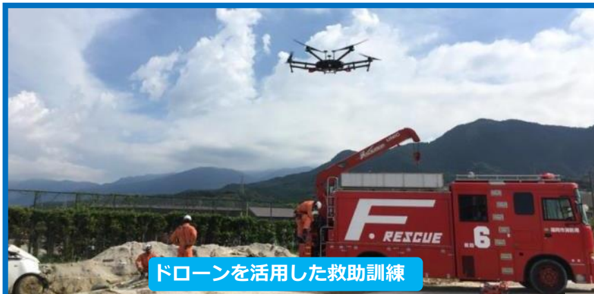
ドローンを活用した救助訓練