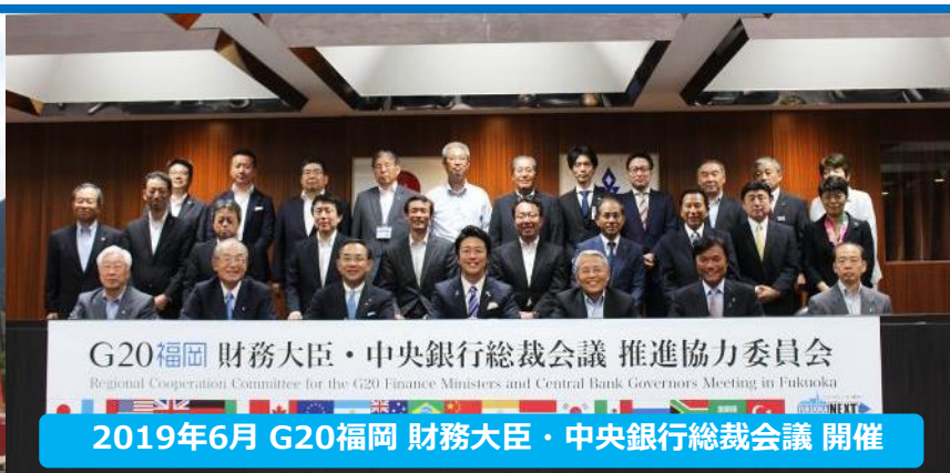
G20福岡 財務大臣・中央銀行総裁会議 推進協力委員会 Regional Cooperation Committee for the G20 Finance Ministers and Central Bank Governors Meeting in Fukuoka