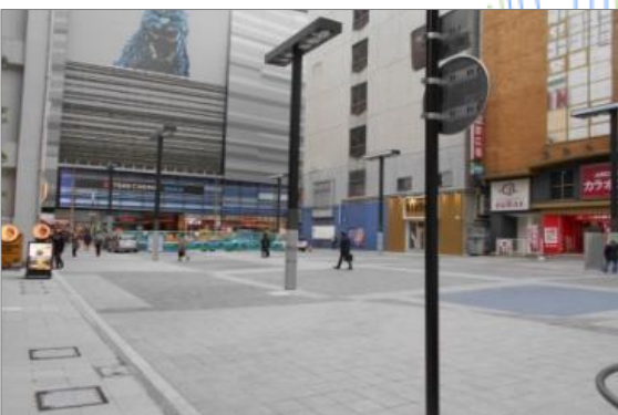
<歌舞伎町シネシティ広場>