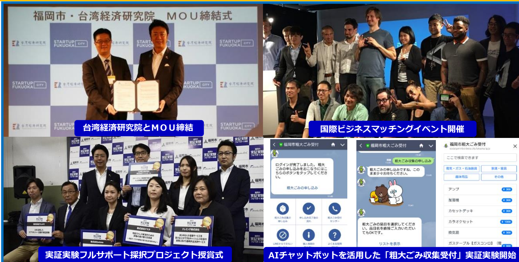
台湾経済研究院とMOU締結