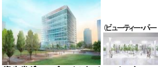
資生堂グローバルイノベーションセンター