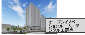
LG グローバル R&D センター