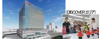
村田製作所みなとみらいイノベーションセンター