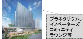
【鹿島建設・住友生命・三井住友海上 賃貸オフィスビル】 (仮称)横浜ゲートタワープロジェクト