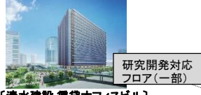
【清水建設 賃貸オフィスビル】 横浜グランゲート GRANGATE