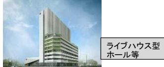
コーエーテックゲームズ新本社