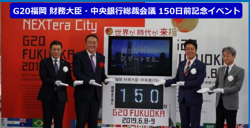
G20福岡 財務大臣・中央銀行総裁会議 150日前記念イベント