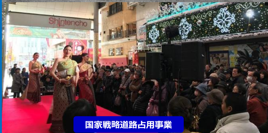
国家戦略道路占用事業