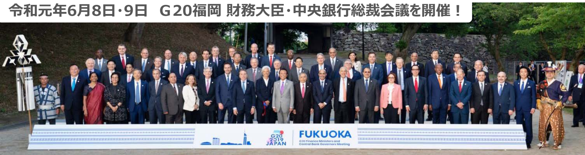
世界経済の未来を福岡で議論