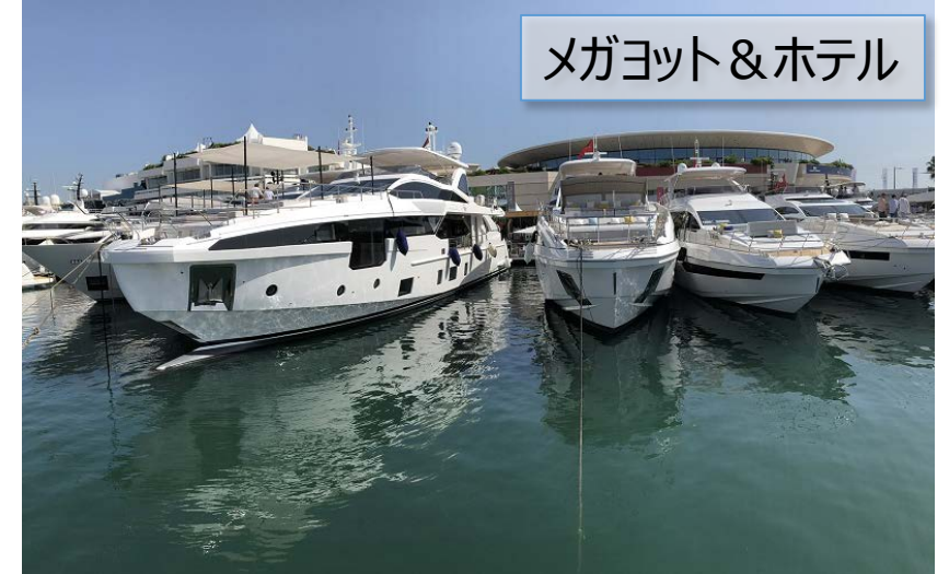
メガヨット & ホテル