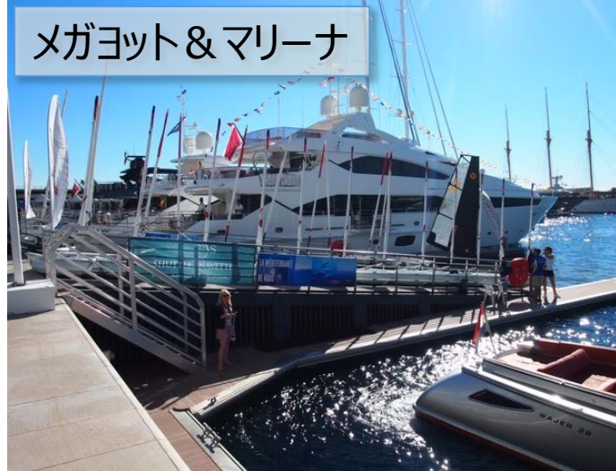
メガヨット & マリーナ