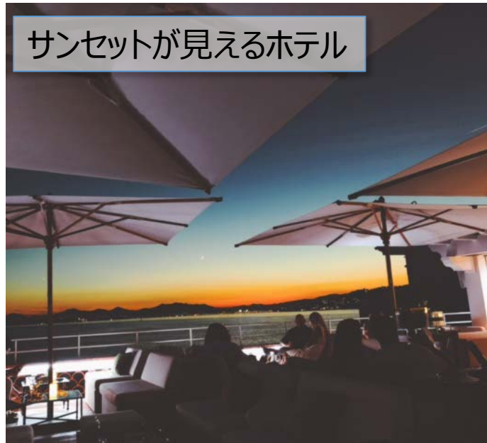
サンセットが見えるホテル