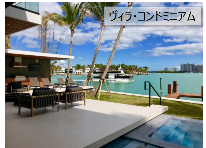
ヴィラ・コンドミニウム