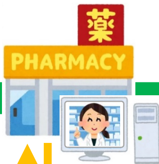
③オンライン服薬指導