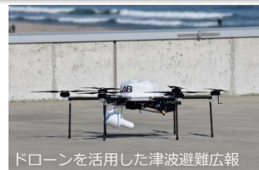
ドローンを活用した津波避難広報