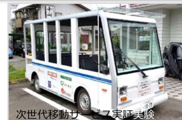
次世代移動サービス実証実験

企業等と行政の双方がWin-Winとなる形で連携、 官民のイノベーション を創出！