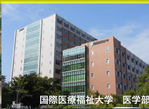
国際医療福祉大学 医学部