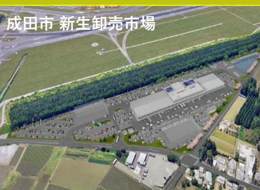
成田市 新生卸売市場