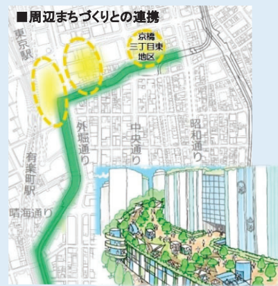
<歩行者ネットワークイメージ>

※東京高速道路(KK線)再生方針及び第4回首都高都心環状線の交通機能確保に関する検討会資料を抜粋・加工して作成