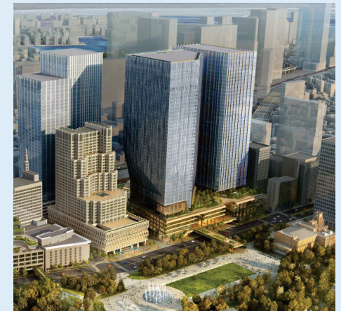
<建物外観イメージ>