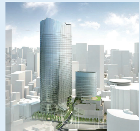
<建物外観イメージ>