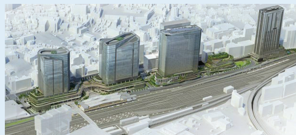
<建物外観イメージ>