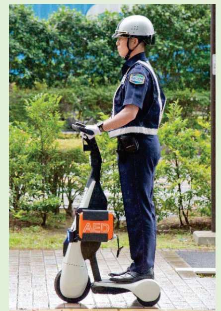
<実際の巡回警備の様子>