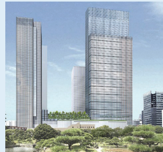
<建物外観イメージ>